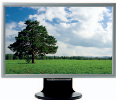
Nachhaltig wirtschaften mit IT

Die Klimaschutzdebatte betrifft nicht nur die Politik, sondern auch die Wirtschaft, darunter die IT-Industrie. Schließlich tragen Informations- und Kommunikationstechnologien dazu bei, die Umwelt zu schützen. Jede Videokonferenz spart Tausende von Flugkilometern. Und der flächendeckende Einsatz von RFID in der Logistik hilft, Prozesse zu optimieren und Leerfahrten von Lkws, Bahnen und Containerschiffen zu verringern.